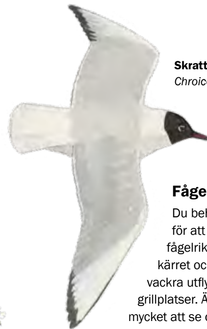
Skrattmås Chroicocephalus ridibundus