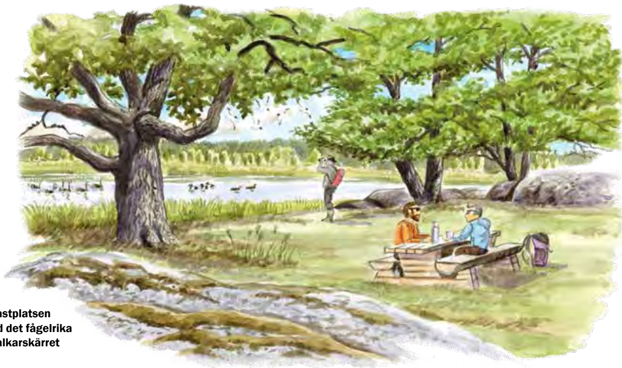
Rastplatsen vid det fågelrika Dalkarskärret