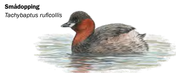
Smådopping Tachybaptus ruficollis