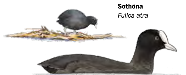
Sothöna Fulica atra