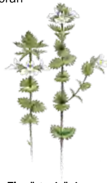
Finnögontröst Euphrasia officinalis subsp. officinalis

Naturen i Hammarskog är omväxlande och det finns mycket att se och upptäcka. Toran är en kuperad och vacker hagmark med hasselbuskar, ståtliga ekar och björkar. I det gamla kulturlandskapet växer örten finnögontröst som är en kräsen specialist med höga krav. Här trivs den och blommar rikligt under senare delen av sommaren. Vill du se Mälaren och Dalbyviken från Toran kan du ta dig upp på utsiktsberget. Utsikten är magnifik. Från Toran är det nära till Vreta udd med sina mjuka och