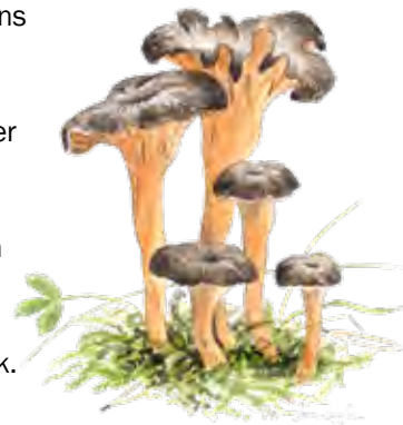
Rödgul trumpetsvamp Craterellus lutescens

släta berghällar som sluttar ner i Mälarens vatten. Här finns grillplatser för dig som vill rasta en stund. Gillar du svamp? I barrskogen växer en släkting till den gula kantarellen som heter rödgul trumpetsvamp och är en god matsvamp. Att den växer i Hammarskog visar att marken är kalkrik.