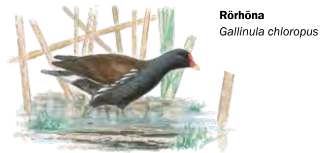
Rörhöna Gallinula chloropus