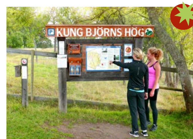
Kung Björns hög är även ett så kallat smultronställe med särskild information på plats.