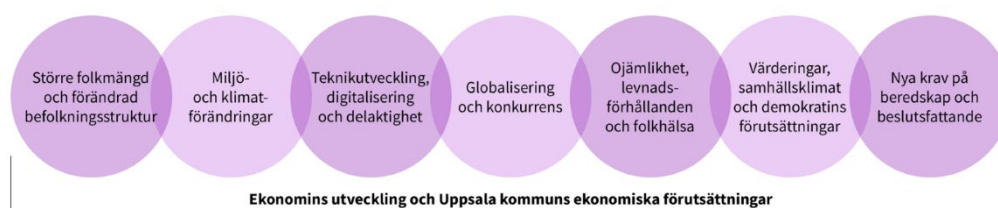
Figur 2: Omvärldsanalys 2024. Källa: Uppsala kommuns omvärldsanalys, uppdateras årligen.

Uppsala kommun och näringslivet påverkas av omvärlden och händelser som ligger utanför vår kontroll. Omvärldsanalysen 2024 lyfter fram sju övergripande trender som sannolikt kommer att påverka Uppsala både på kort och lång sikt.