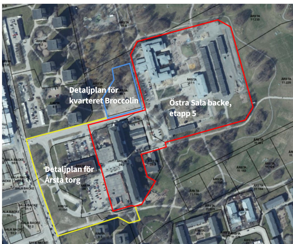
Figur 2 Planrådets ungefärliga avgränsning markerat med röd linje. Blå och gul avgränsning visar intilliggande laga kraft-vunna detaljplaner som inte genomförts ännu.