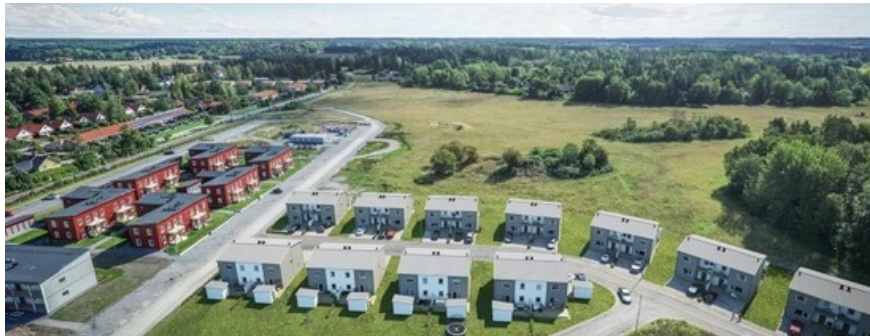
Flygfoto med fotomontage, Boklok

Planen anger också att bebyggelsen kan utformas tätare och högre – upp till tre våningar – vid huvudgatan, medan bebyggelsen ska vara glesare och lägre längre ifrån gatan. Läs mer om hur Storröta utvecklas .