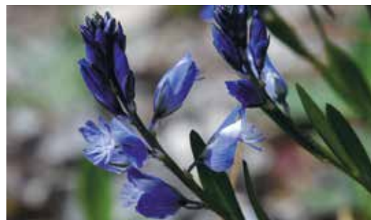
Jungfrulin, Polygala vulgaris .

Hågadalens åker- och betesmarker inramas av lövrika bryn och lundar samt öppna slånkantade torrbackar. Bactimjan, korskovall, backsippa, toppjungfrulin och vanlig jungfrulin är några exempel på den fina flora som finns i betesmarkerna runt Hågahögen. I hela området finns ett varierat fågelliv med bland annat skogsduva, nötkråka och flera hackspetts- och ugglearter. Och var uppmärksam när du promenerar längs med Hågaån, om du har tur kan du få syn på en utter!