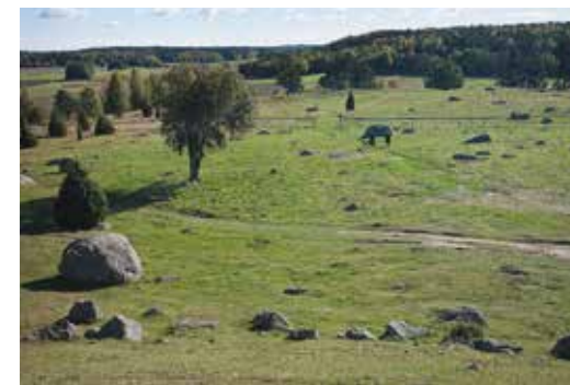
Vy från Kung Björns hög.

Hågahögen – ”Kung Björns hög” Högen, som ordet ”Håga” härstammar ifrån, har gett namn åt hela dalen och ån. Det är en stormansgrav från bronsåldern som innehöll en av de rikaste gravutrustningarna i Sverige från denna tid. Vid utgrävningen hittade man bl.a. ett guldutsmyckat bronssvärd, spänne och en rakkniv av brons. Sagokungen Björn sägs ha bott i närheten av gravhögen under vikingatiden, därav det andra namnet på högen. Från toppen har du en fantastisk utsikt över dalen och här trivs många fina kärllväxter och insekter.