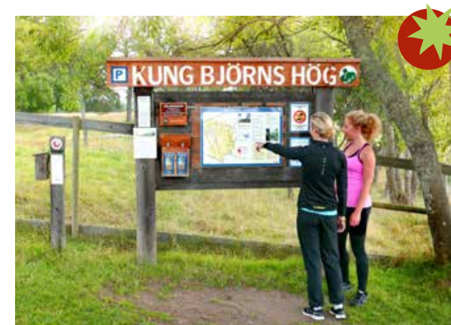
Kung Björns hög är även ett så kallat smultronställe med särskild information på plats.