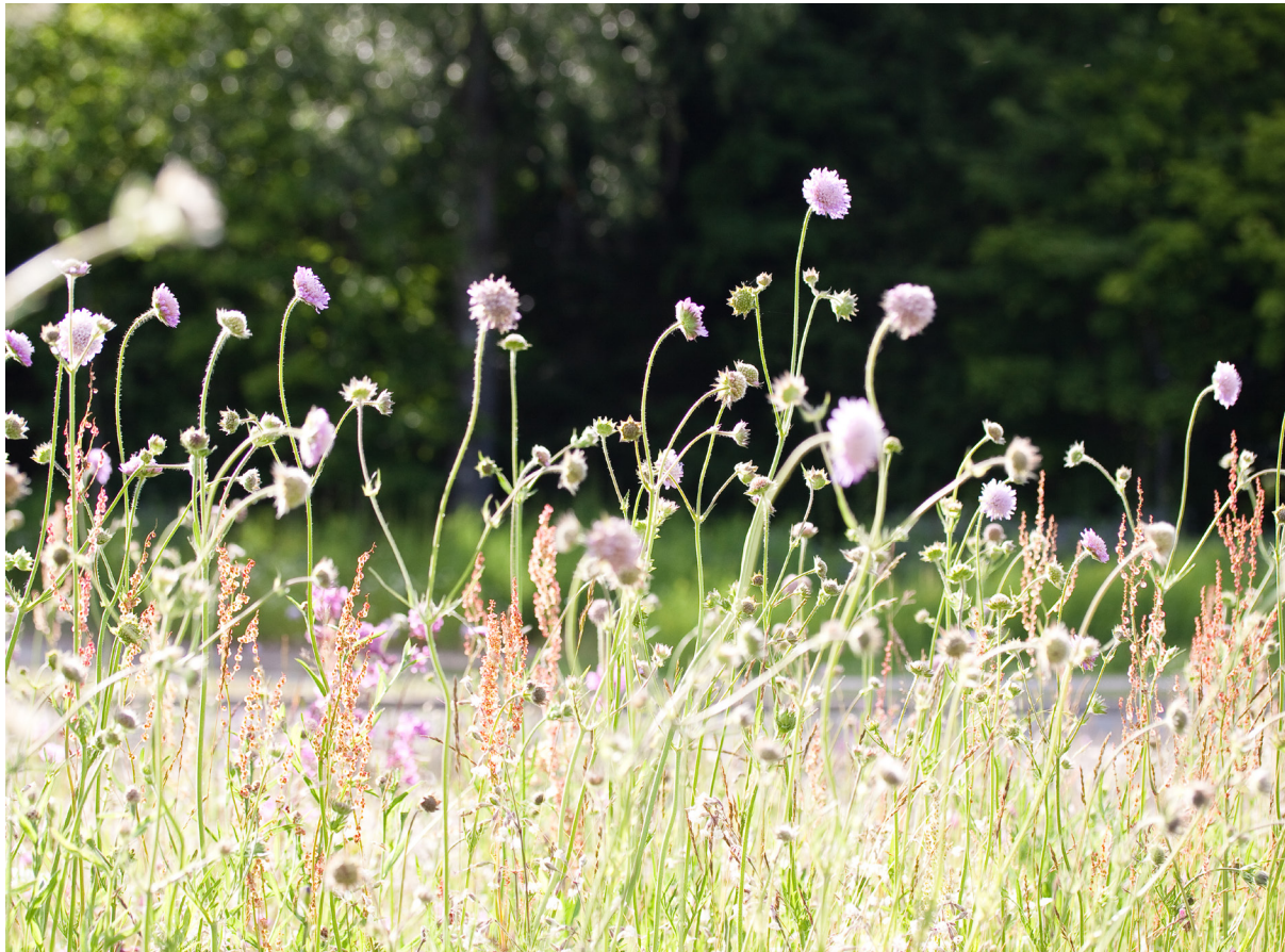
Rondelläng Dag Hammarskjöldsväg

Plankartorna förhåller sig till bakgrundskartan på så vis att värdefull park- och naturmark markeras enligt plankartans tema, en del befintlig park och naturmark förblir omarkerad på samtliga kartor och en del nya områden föreslås utanför bakgrundskartans markeringar.