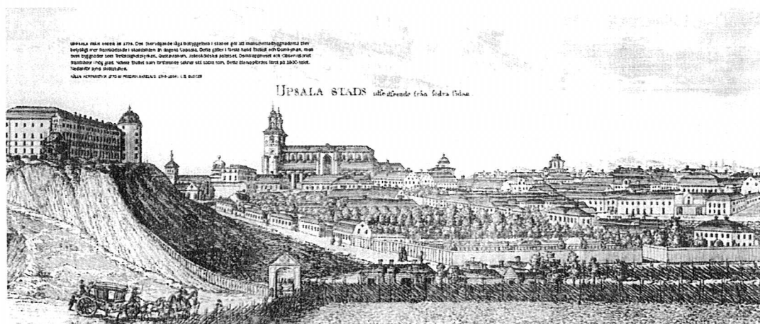
Uppsala år 1770. Eftersom huvuddelen av stadens bebyggelse var låg dominerade de högt placerade monumentalbyggnaderna staden än mer än vad de gör i dag. Källa: Kopparstick av F. Akrelius

Både Domkyrkan (119 m hög) och slottet (42 m högt) är strategiskt placerade på den höga Uppsalaåsen och har därmed givit staden en berömd och unik silhuett som inte liknar någon annan stads. Under 1800-talet manifesterades stadens roll som universitetsstad med ytterligare två högt belägna byggnader, universitetsbiblioteket Carolina Rediviva och Universitetshuset, även dessa strategiskt placerade på höga partier. Vid den tid då dessa monumentalbyggnader tillkom måste de ha upplevts än mer dominerande än vad de gör idag. Den övriga bebyggelsen var då med några få undantag uppförd i en till två våningar.