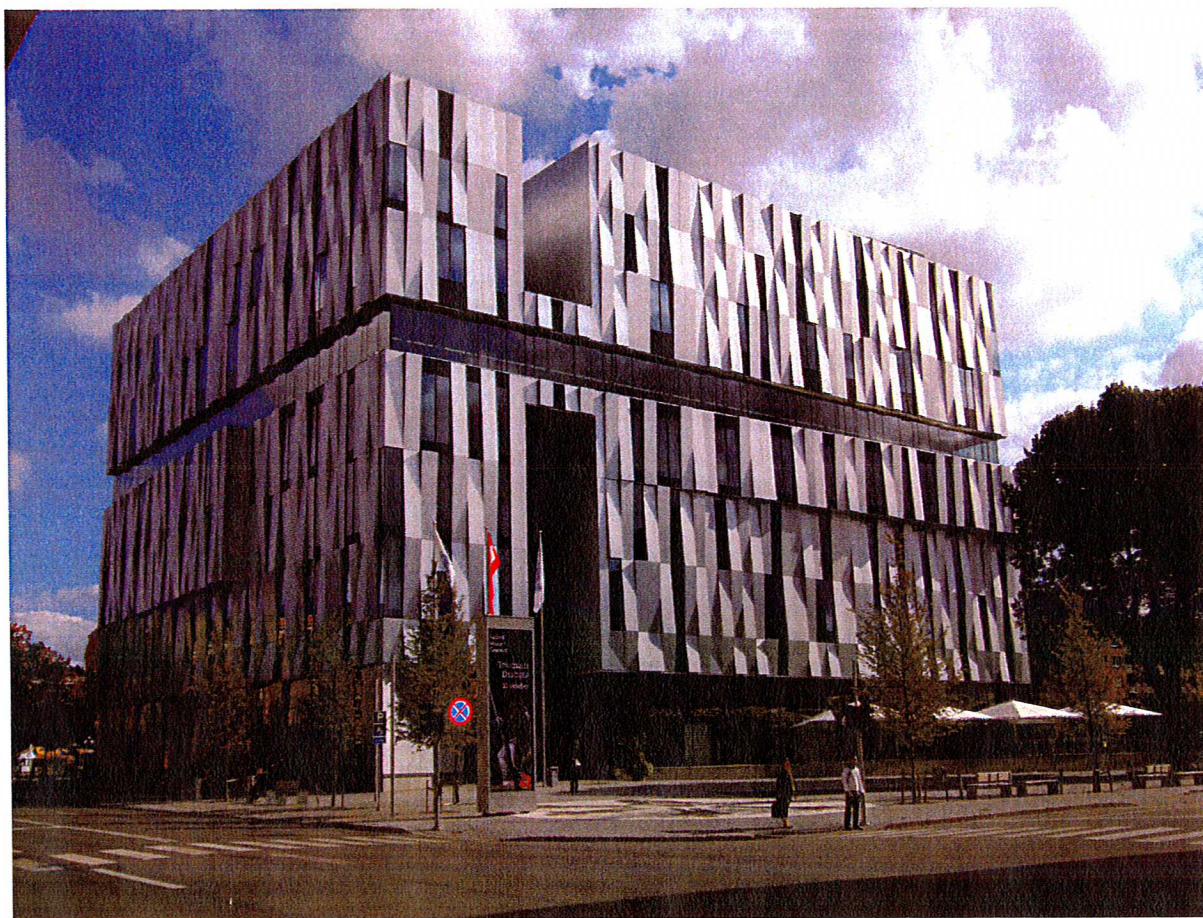
Uppsala konsert- och kongresshus. Arkitekt: Henning Larsen Tegnestue / Johnny Svendborg.

Under senare år har begreppet märkesbyggnad blivit allt vanligare. En märkesbyggnad kan vara en låg eller hög byggnad. Men den ska gärna i positivt bemärkelse vara karaktärsskapande. I denna rapport lyfts framför allt högre märkesbyggnader fram. Dessa utgör en del av stadens silhuett, har unika funktioner och mycket hög arkitektonisk kvalitet. De har en genomtänkt placering med intilliggande platsbildningar och är ofta en del av stadens varumärke.