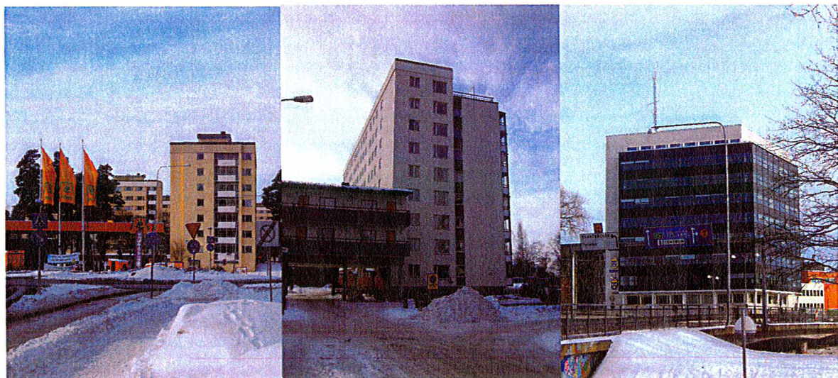
Några exempel på byggnader från 1700-, 1800-, 1900- och 2000-talet som var relativt höga när de uppfördes.