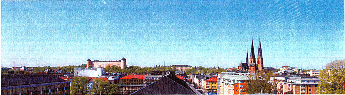
Vy från Uppsala konsert- och kongresshus.