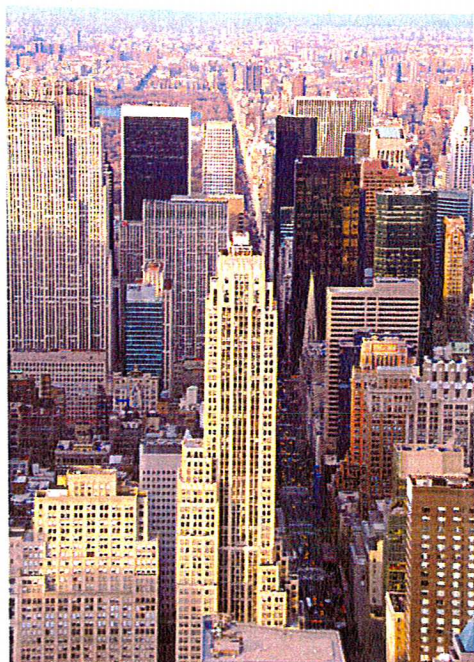
New York.

USA var länge ledande när det gällde att bygga höga hus. Nu leds utvecklingen av fr a Kina och Emiraterna i Mellersta Östern. I Europa är det miljonstäder som London och Paris som är mest aktiva i denna utveckling, men även en rad andra europeiska storstäder har ambitionen att bli skyskrapestäder. Bland dessa praktiseras två tydliga utvecklingsalternativ. Ett är att bygga högt i centrum och det andra att spara den gamla, lägre stadskärnan och bygga högre utanför denna. I Paris har man valt det senare alternativet. I Stockholms lägesredovisning rörande höga hus (Stadsbyggnadskontoret 2008) redovisas också ett mer varsamt synsätt i förhållande till centralt belägna märkesbyggnader. Av sammanfattningen framgår att ”det är ingen självklarhet och inget självändamål att bygga en hög stad. Om vi ändå väljer att tillåta hög bebyggelse kan några placeringar som markering för plats eller funktion prövas: stråk, nod och kluster. Huvudmålet för planering av all ny bebyggelse ska vara: rätt byggnad i rätt sammanhang. Varje nytt projekt ska utgöra ett positivt tillskott till staden som helhet”. Även i andra svenska städer är frågan om höga byggnader aktuell.