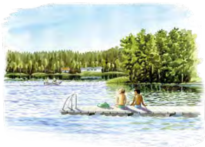
Badbryggan vid Långsjön