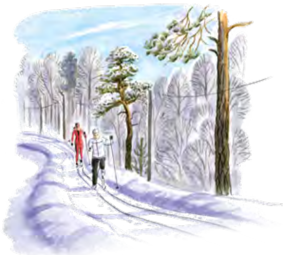
Längdskidåkning i elljusspåret