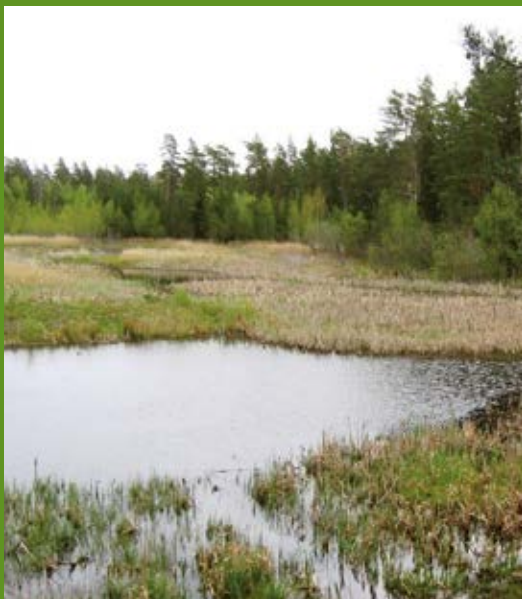
Viltvattnet i Vedyxaskogen.

Vid frågor nås friluftsområdets förvaltare på telefon 018-727 40 45.