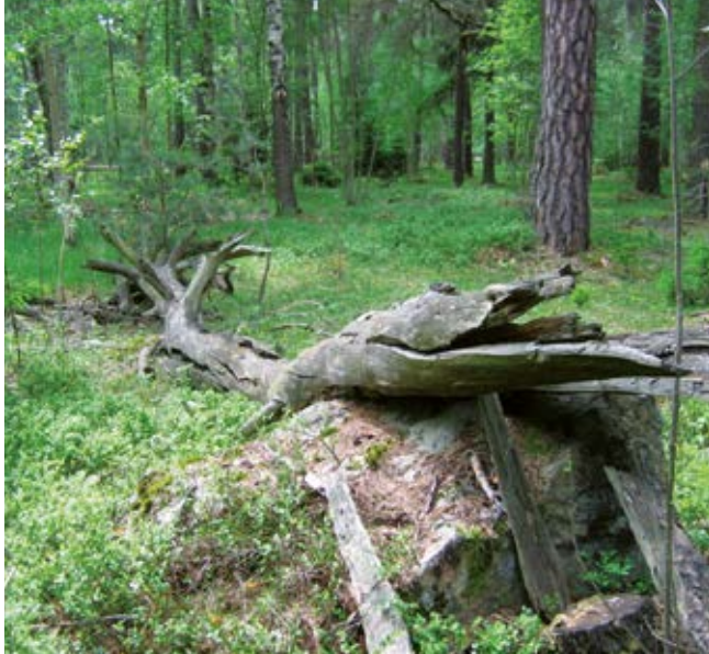
Äldre murket vindfälle i Kronparken.