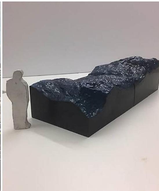
Laura Könönen, Silent Water/Hiljanen Vesi , invigs 2019