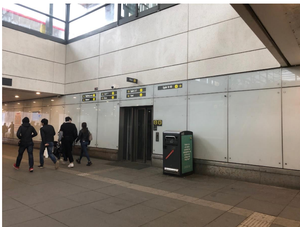
Befintliga glasväggar och hiss