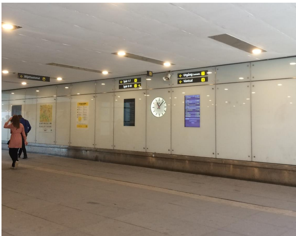
Norra väggen, glaspartier och informationstavlor (sommartid)