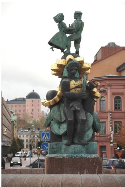
Bror Hjorth, Näckens polska , 1967