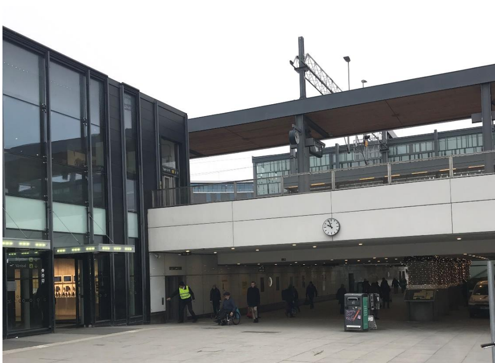
Centralpassagen, Stationshuset till vänster