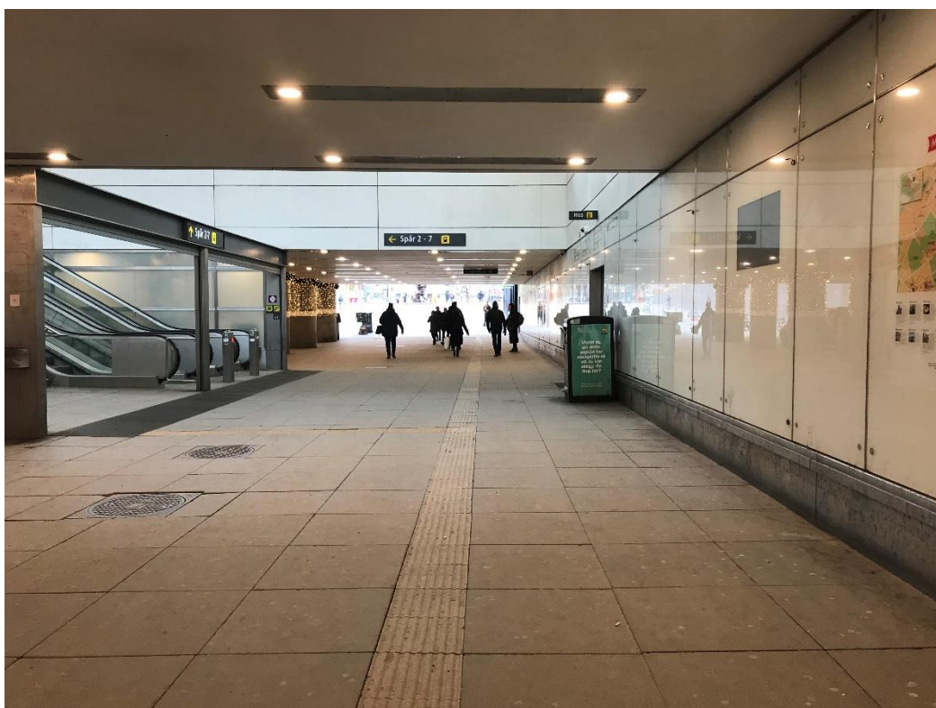
Centralpassagen från Frodegatan, trappor till perrongen till vänster