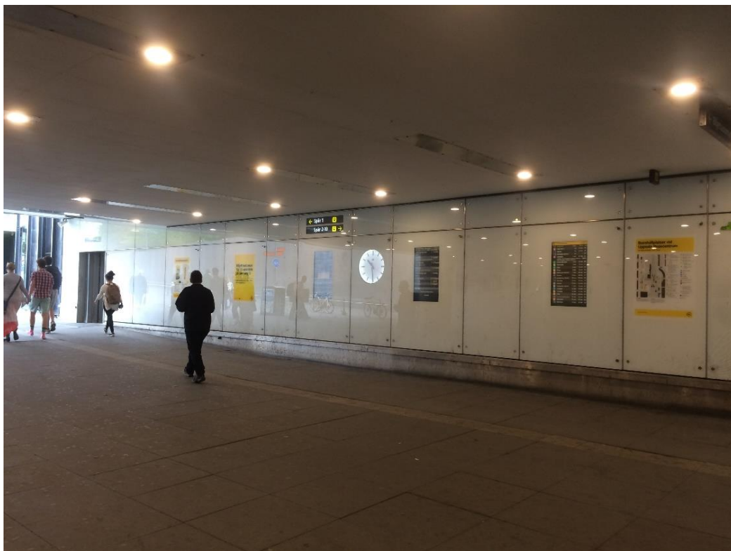
Norra väggen, befintlig belysning i tak