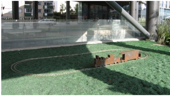
Pernilla Sylwan, Lilla tåget , 2013