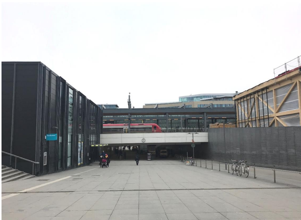
Centralpassagen rakt fram från Vretgränd, spårområdet ovanför