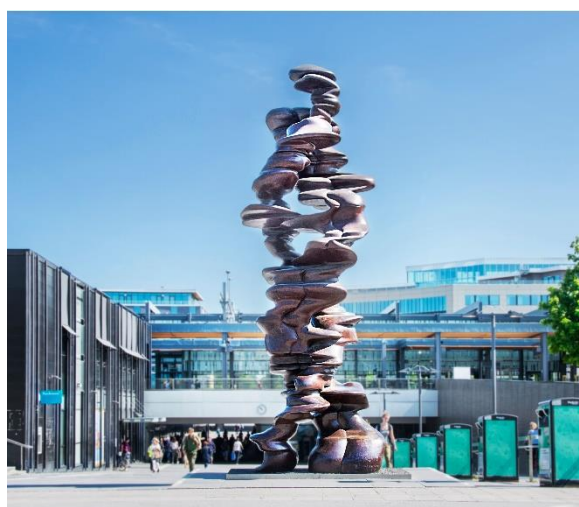
Tony Cragg, Discussions och Chain of events , 2005