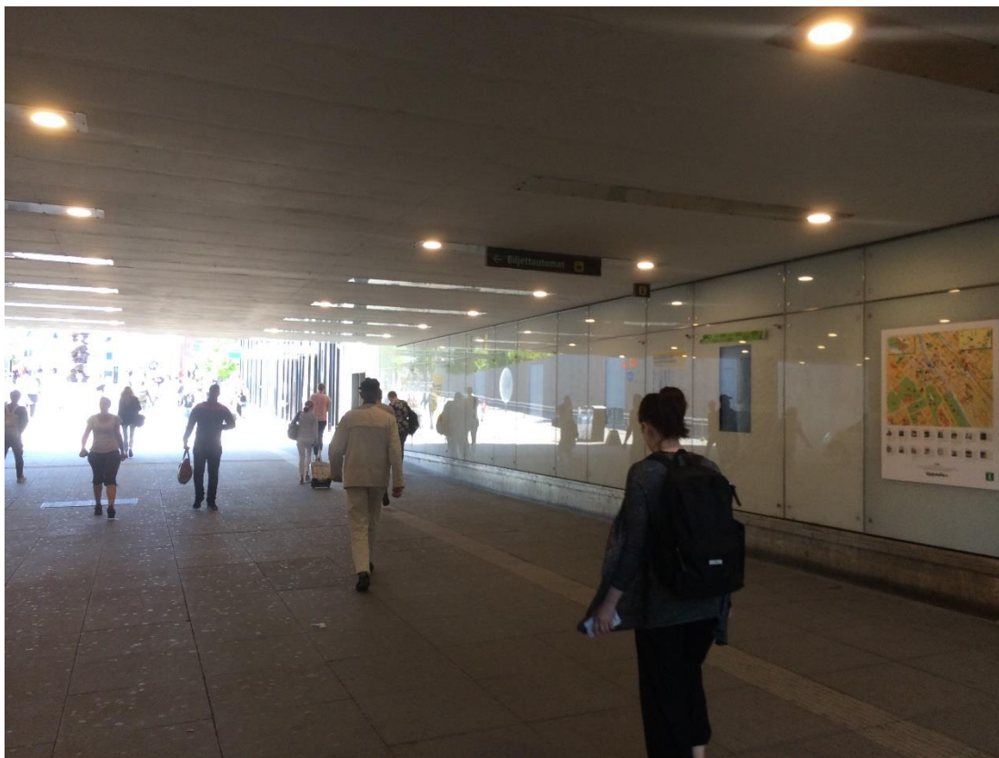
Ett stort antal människor passerar här dagligen