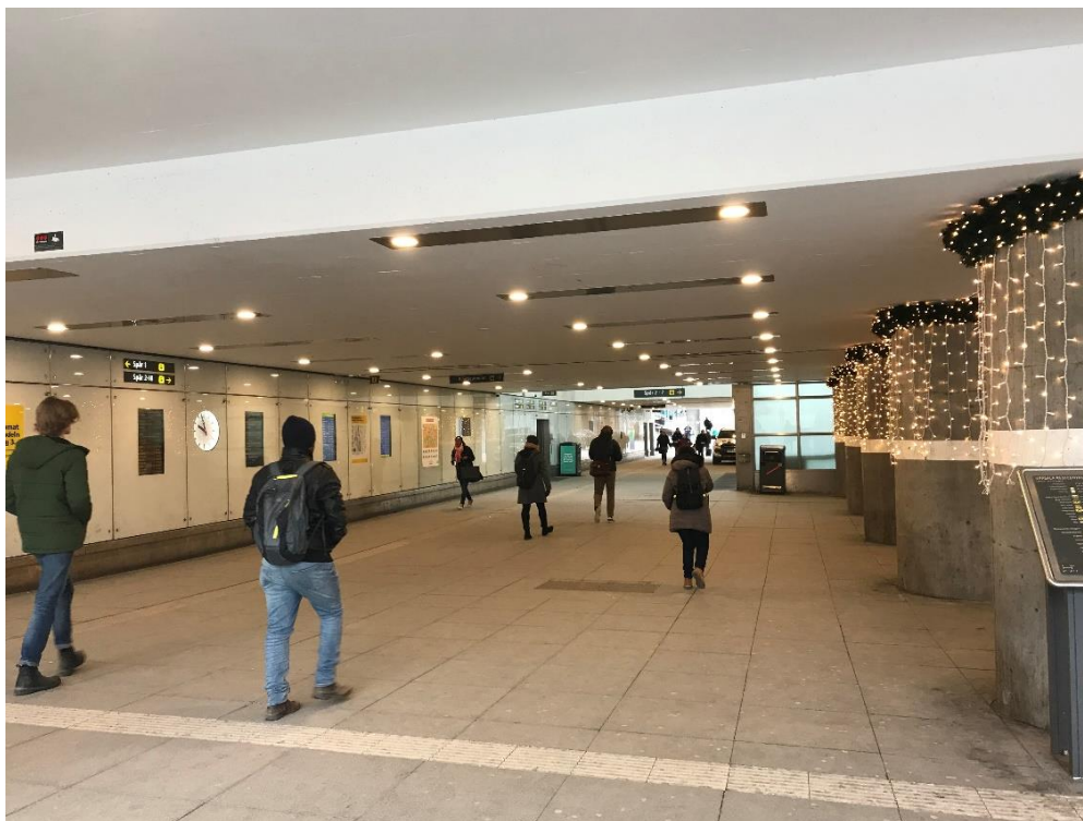
Centralpassagen, norra väggen till vänster (vintertid)