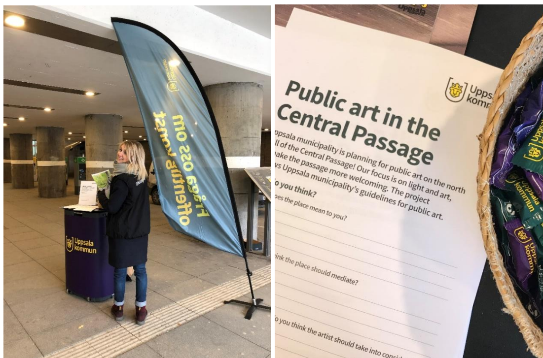
Medborgardialog i Centralpassagen, Offentlig konst Uppsala kommun