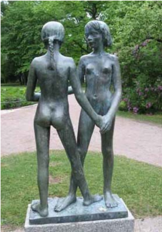
Två systrar , 1947, Stig Blomberg