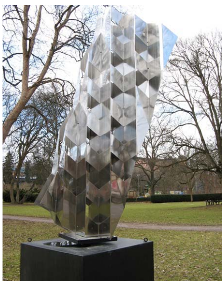
Ljusvandring, 1992, Staffan Östlund