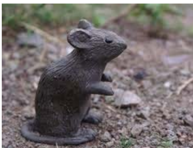
Linnés mus, 2007, Anna-Karin Brus