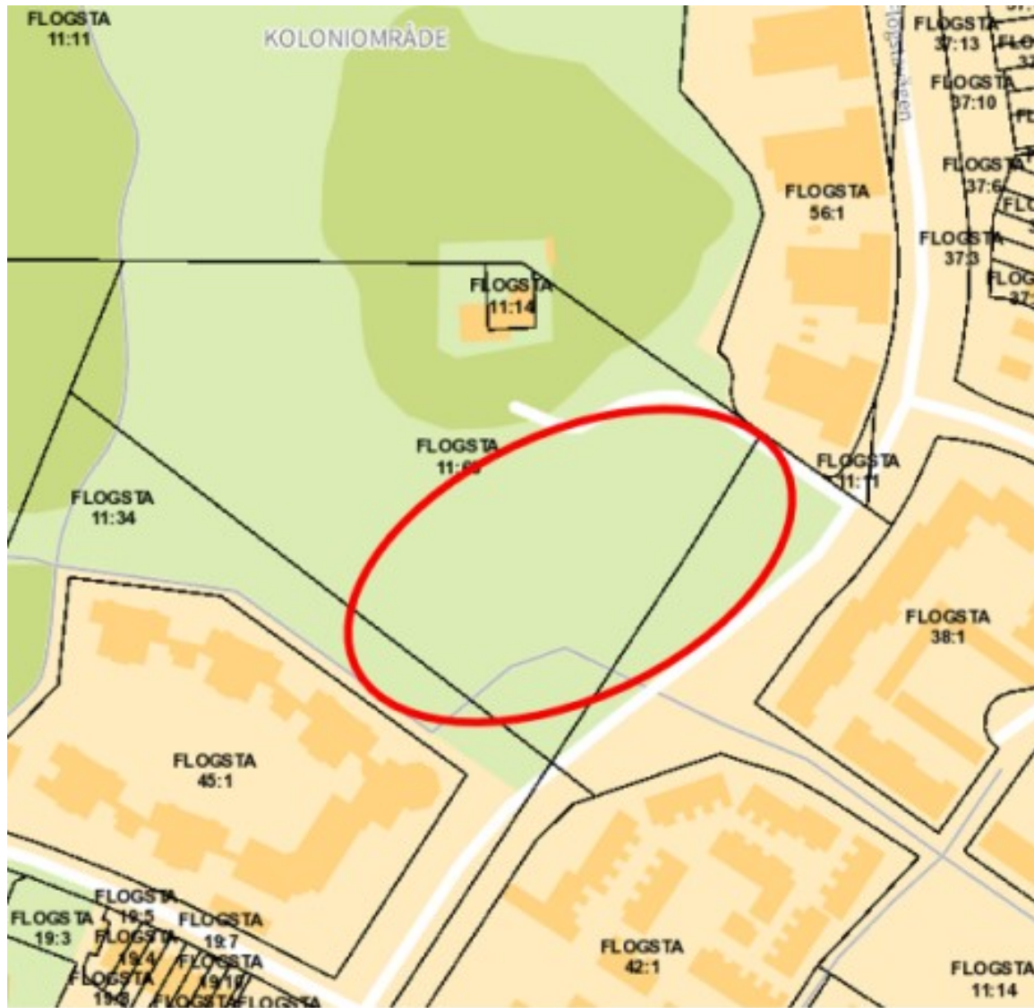
Detaljplanens läge i Flogsta