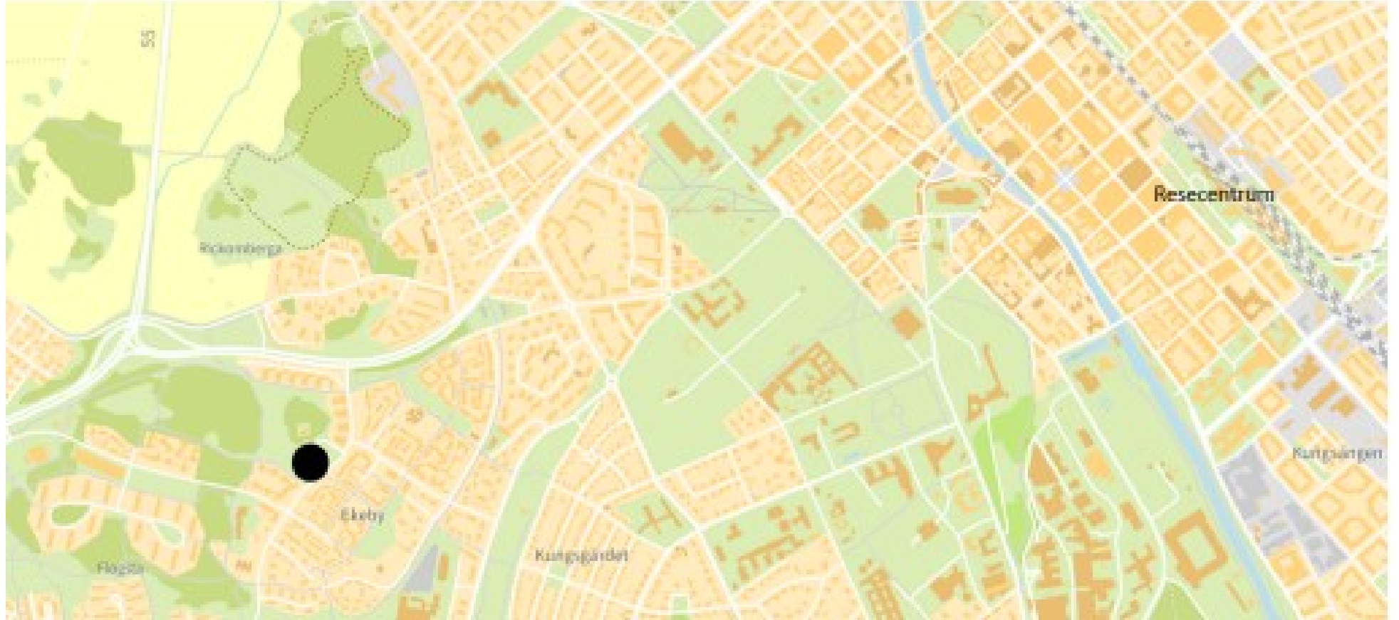
Detaljplanens läge i Uppsala.