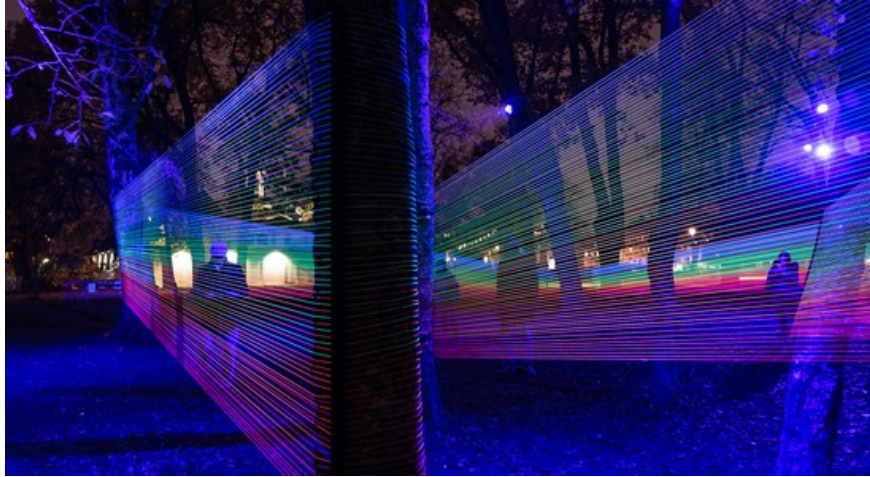
Uppsala planerar för boexpo och att ansöka om att bli kulturhuvudstad till 2029.