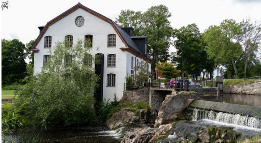
Ulva kvarn, ett av Uppsalas mest populära utflyktsmål.