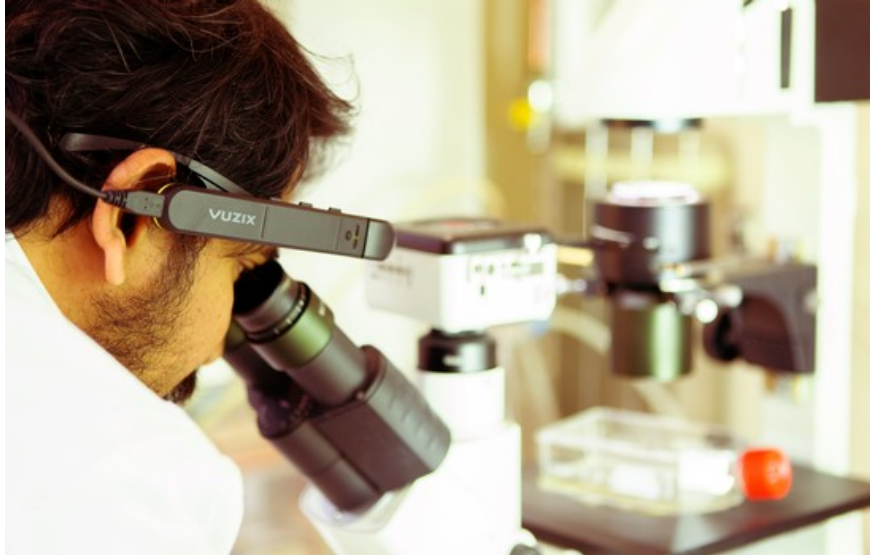
Finländska företaget Sciar prövade sina unika AR-glasögon i Testa Centers labb.