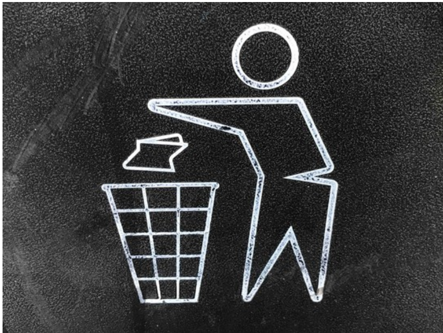
Klicka på bilden för att se en introduktion till avfallsplanen, vad den ska innehålla och hur tidplanen för arbetet ser ut.

Läs intervjun med Sciars vd Joel Noutere.