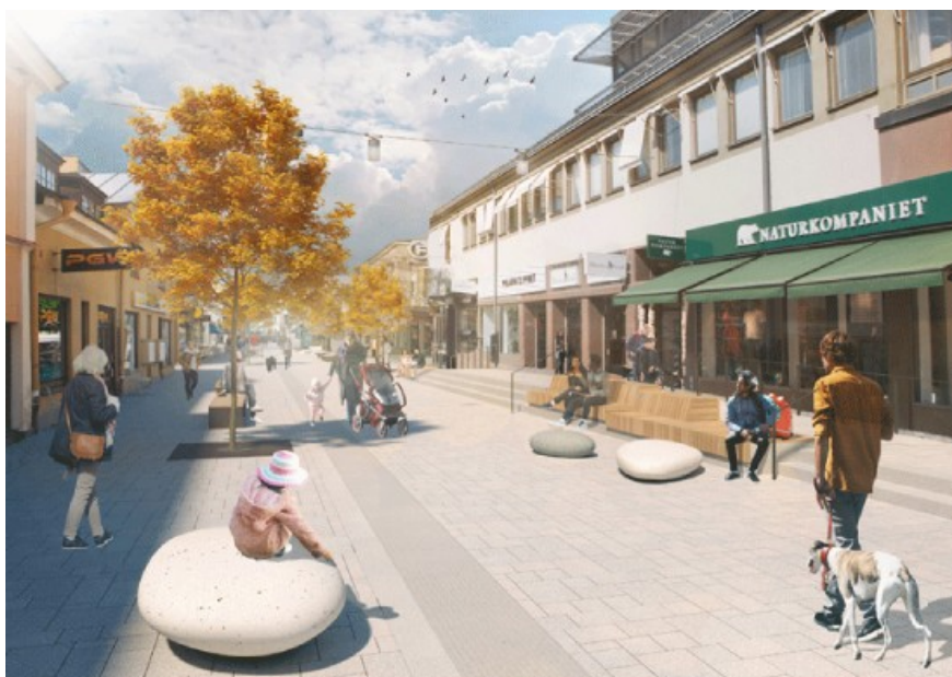
Gågatan ska vara tillgänglig, trygg och prioriteras för gående. Gatan får ny växtlighet, bänkar och sittpuffar. Illustration: Karavan landskapsarkitekter