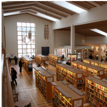
Besökarnas mobiler visar hur de rör sig i lokalen.