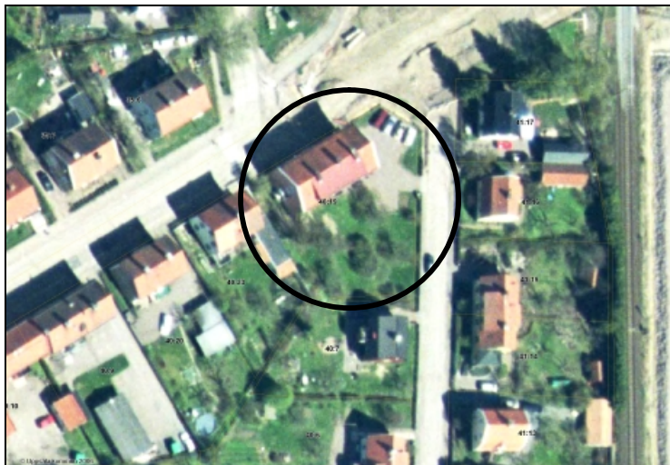
Ortofoto över Svartbäcken 40:19 och dess närmaste omgivning.

Fastigheten Svartbäcken 40:19 gränsar i norr till Gamla Uppsala-gatan och i öster till Valhallagatan. I söder och väster gränsar fastigheten till två av kvarterets villatomter. Arealen utgör 1.363 m 2 . Fastigheten är i privat ägo.