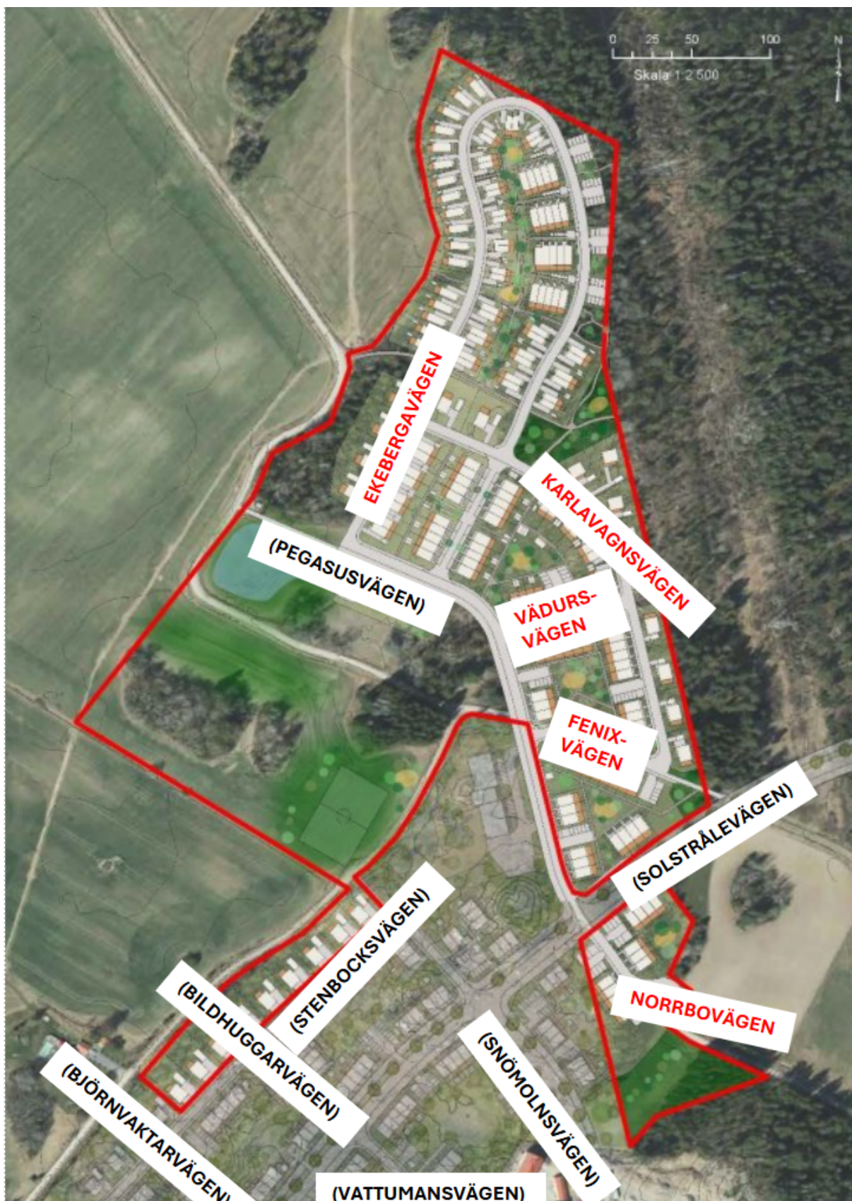
Nya namnförslag i röd text. Befintliga namn i svart text inom parentes.