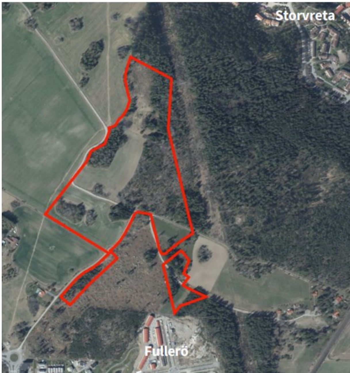
Planområdets utbredning mellan Storvreta och Fullerö