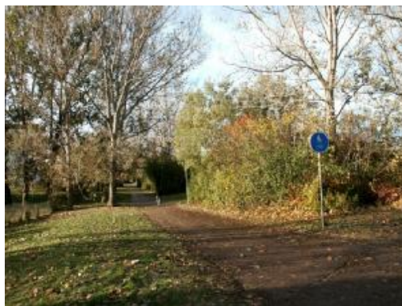
Cykelväg söder om området