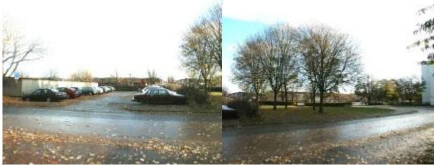
gräsyta och befintlig parkering

ordna ett 50-tal parkeringar inramade med häckplantering och mindre träd.