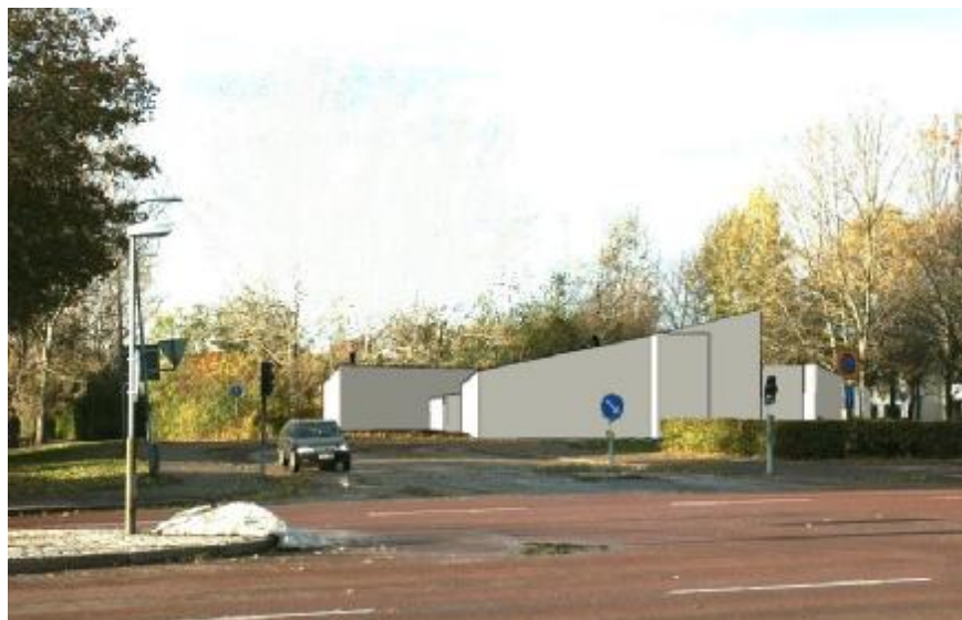
fotomontage - vy från Råbyvägen Illustrationen är endast preliminär och kan komma att ändras

Den planerade kyrkobyggnaden kan dock komma att kunna fungera väl i stadsbilden med sitt låga och lätta uttryck.