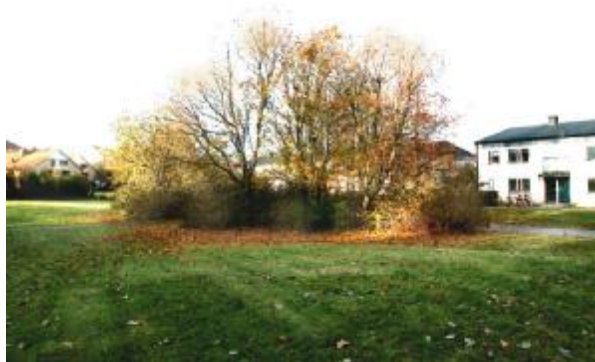
Träddunge som sparas

En del av de traddungar som finns i området kommer att försvinna medan andra kommer att behållas.