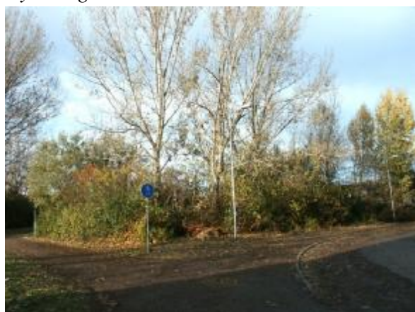
Träd & buskage som tas bort