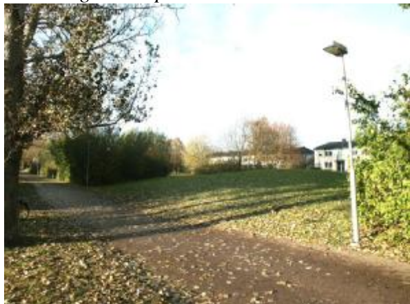
Plats för kyrkobyggnaden