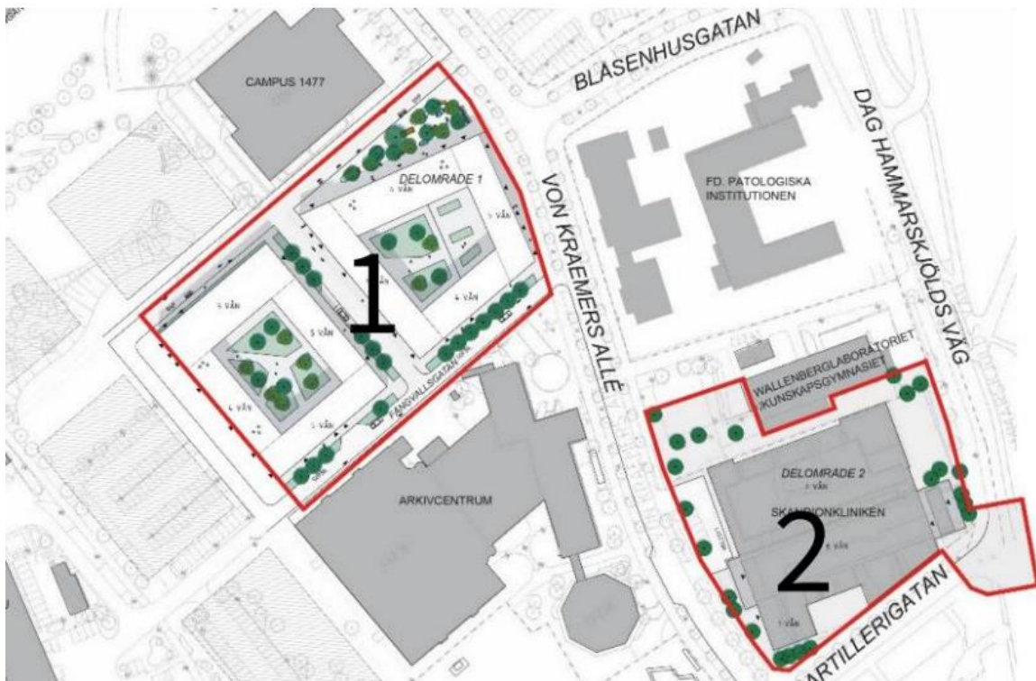
Illustrationsplan över planrådets två delområden