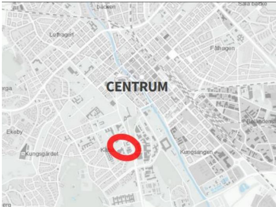
Planområdet markerat med rött