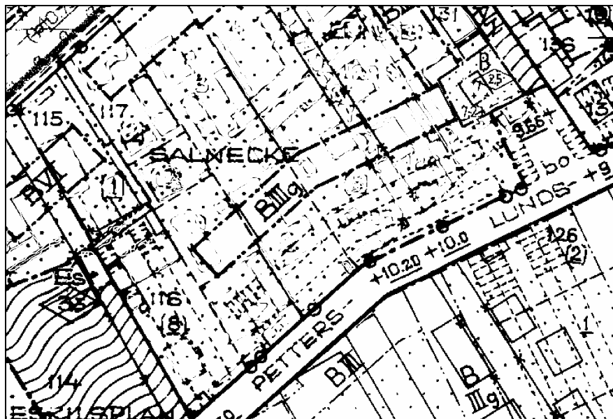
Tidigare antagen detaljplan.