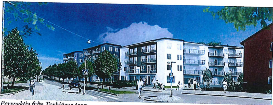
Perspektiv från Torbjörns torg.