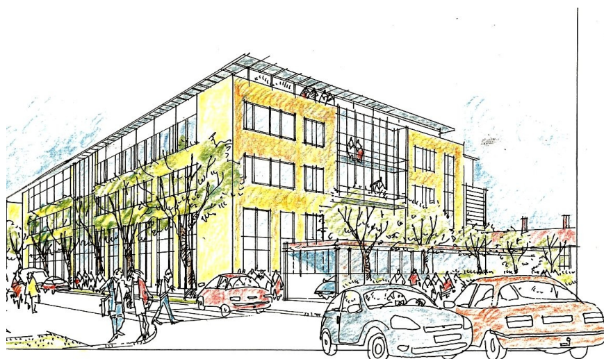
Illustrationsskiss – ny kontors-/laboratoriebyggnad Brunnberg & Forshed Arkitektkontor AB

För området gäller skyddsbestämmelser för grundvattentäkt fastställda av länsstyrelsen 1989. Planområdet ligger inom den yttre skyddszonen.