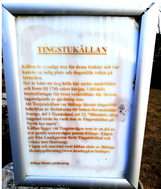
Skylt vid Tingstukällan