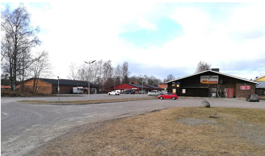
Livsmedelsaffären Träffen, en samlingspunkt i nuvarande Bälinge centrum. I bakgrunden syns Klockarbols förskola