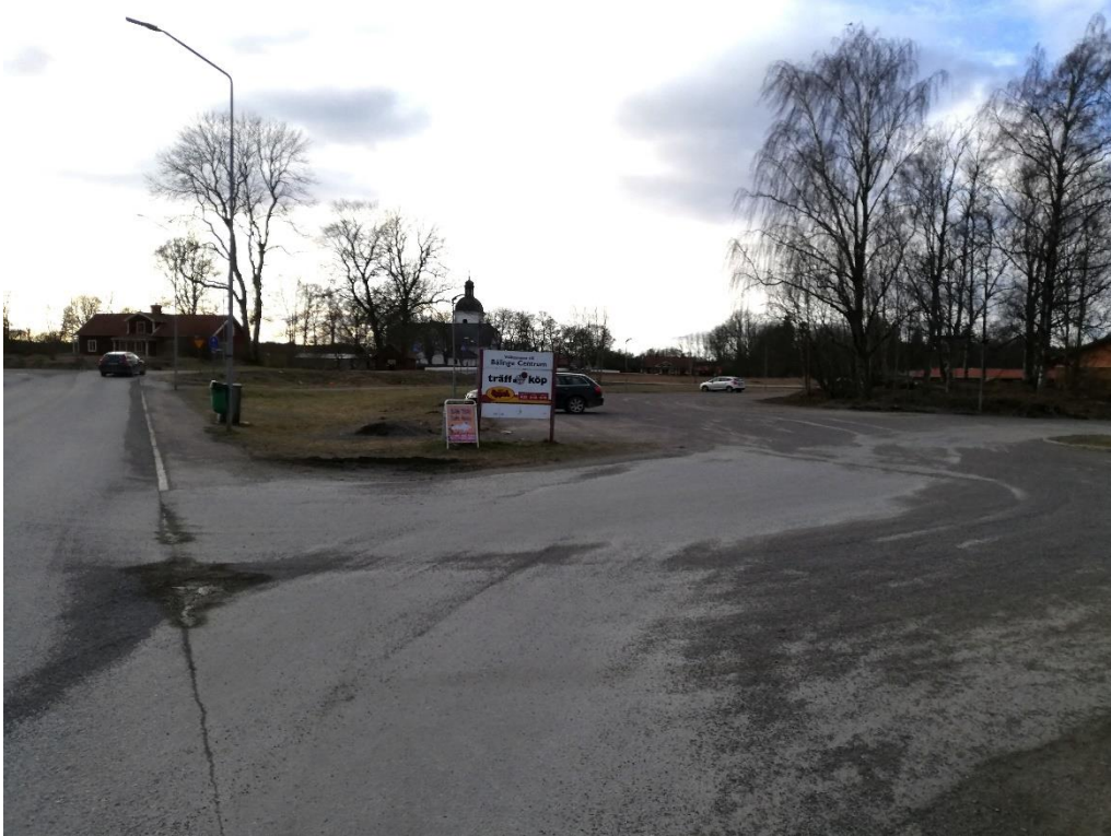
Infarten till Träffen, Bälinge centrum. Bälinge kyrka i bakgrunden.