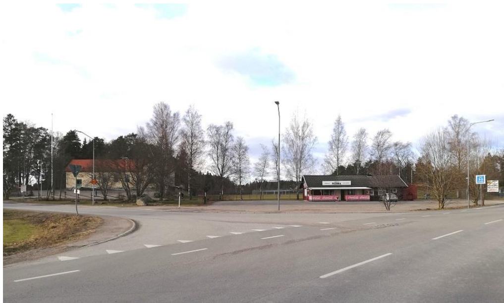
Bydegården i Bälinge och Pizzerian – två samlingspunkter i Bälinge.