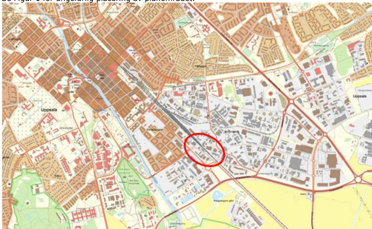
Figur 1. Ungefärlig placering av planområdet markerat i rött.

Se Figur 1 för ungefärlig placering av planområdet markerat i rött.