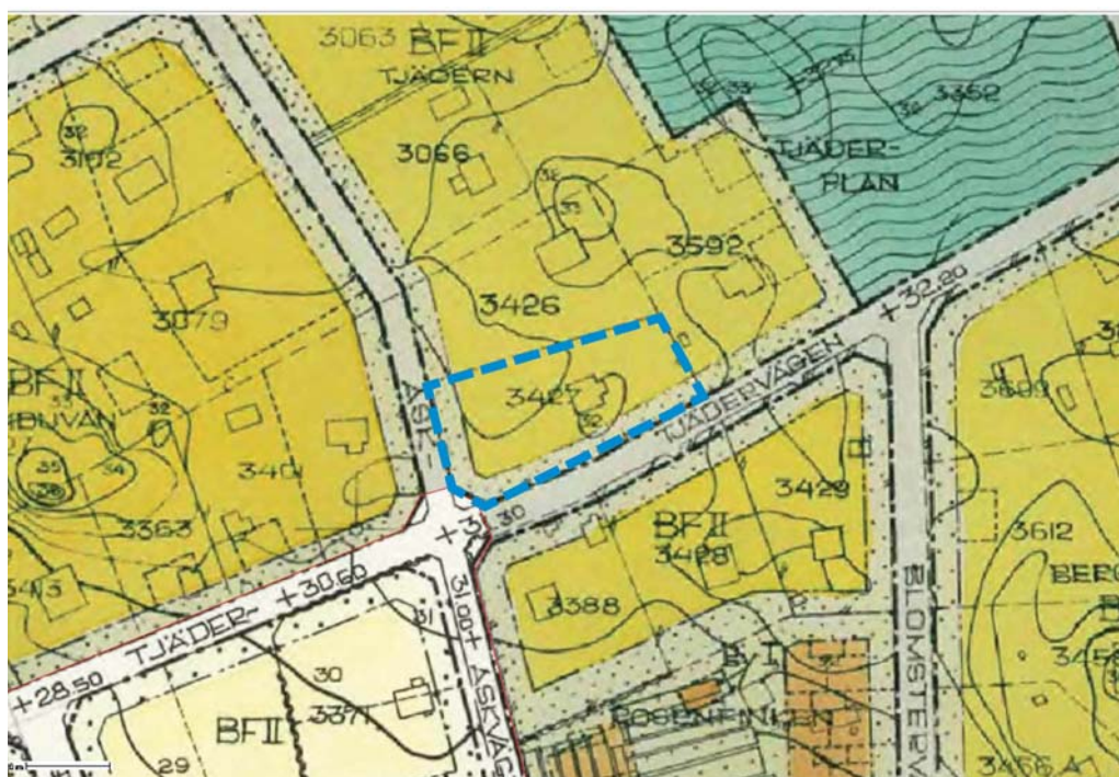
Utdrag ur gällande detaljplan. Planområdet markerat i blått.

Gällande detaljplan, som ändras genom tillägget, är stadsplan för sydvästra Sunnersta, pl. 83, med laga kraft 1970-06-29. Tillåten markanvändning inom planområdet är bostadsändamål för fristående hus. Det finns ingen bestämmelse som reglerar minsta tillåtna tomtstorlek. Upplysningar om fler planbestämmelser i gällande detaljplan finns med på plankartan som redovisar tillägget.