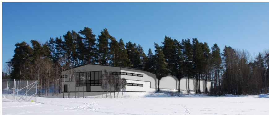
Perspektivskiss: Curlinghallen sedd från sportfältet (från nordväst). Skissen upprättad av A5 Arkitekter AB.

Byggrätten i gällande plan utökas för att ge plats för hallen. Höjdmässigt sker ingen förändring, det vill säga att + 43.0 meter över nollplanet bibehålls som högsta tillåtna höjd.