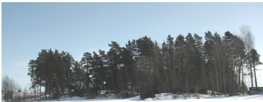
Planområdet sett från sportfältet (från nordväst). Foto vintern 2006. I vänstra bildkanten ses Ica Maxi skymta och i högra bildkanten ses transformatorstationen vid Naturstensvägen.

Vid utbyggnaden kommer delar av nuvarande skogsmark att påverkas. Det är angeläget att så långt möjligt bevara vegetationen mellan byggnaden och Naturstensvägen.