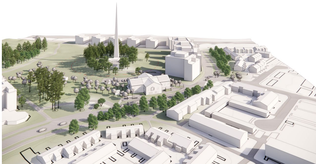
Figur 1 - Volymillustration över förskolebyggnadens påverkan i relation till befintlig bebyggelse, Tengbom.