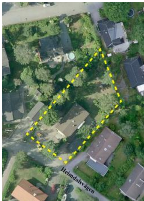
Planområdet markerat med gul streckad linje.

Fastigheten har använts till förskoleverksamhet sedan 1988 och är idag bebyggd med ett enbostadshus i en våning och en komplementbyggnad. Idag hyr Pilfinkens montessoriförskola lokalerna. På tomten finns en lekplats och en del vegetation. Tomten är omgärdad med staket och det finns cykelparkering och parkering med plats för två bilar.