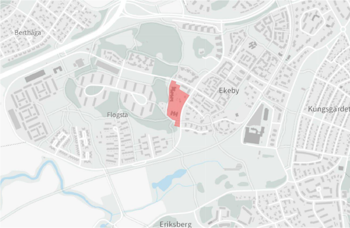
Bild med läget för planområdet Flogstaskolan.