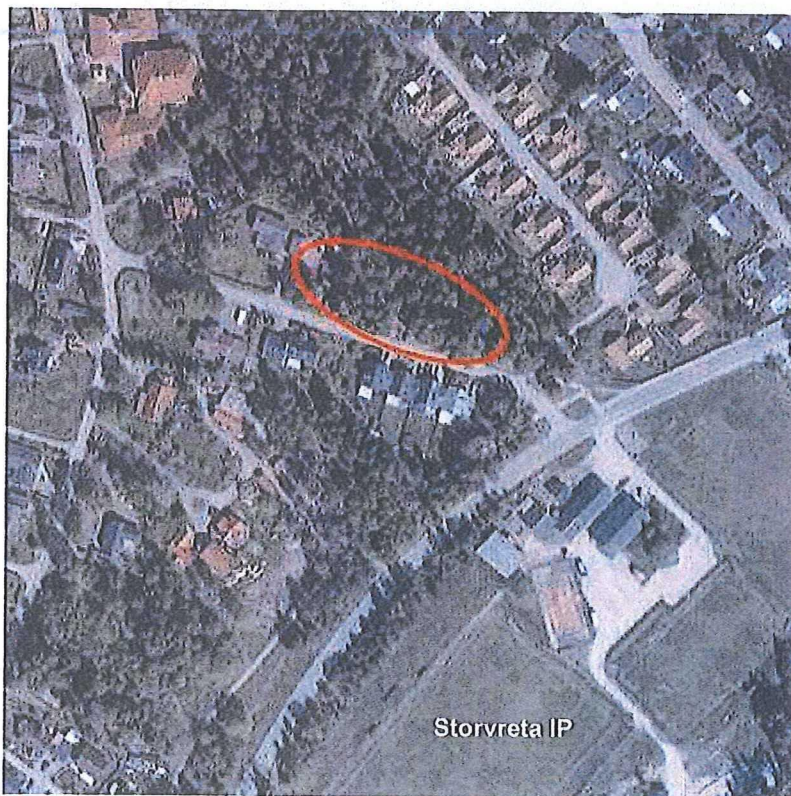
Röd markering visar planområdets läge på ortofoto.