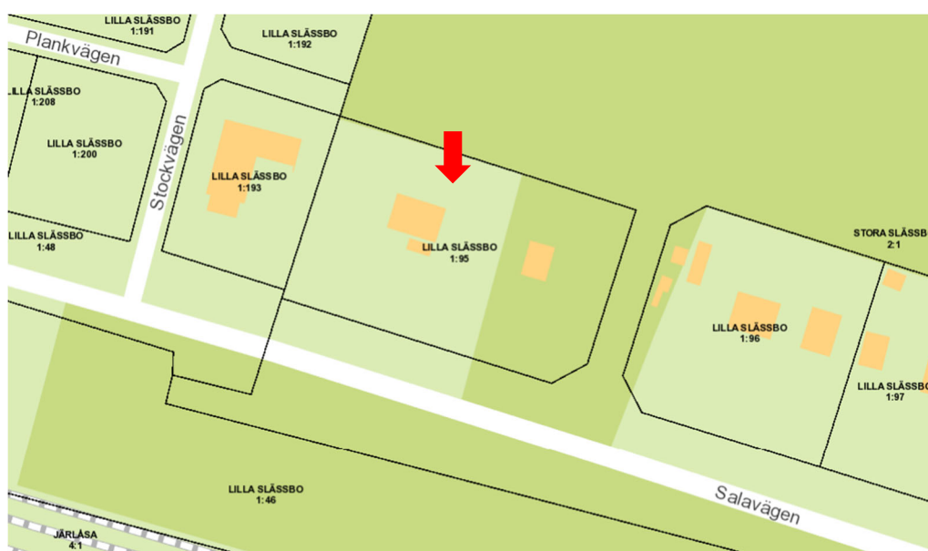
Figur 23 Kartan visar de aktuella fastigheten Lilla Slässbo 1:95 samt omgivande fastigheter.