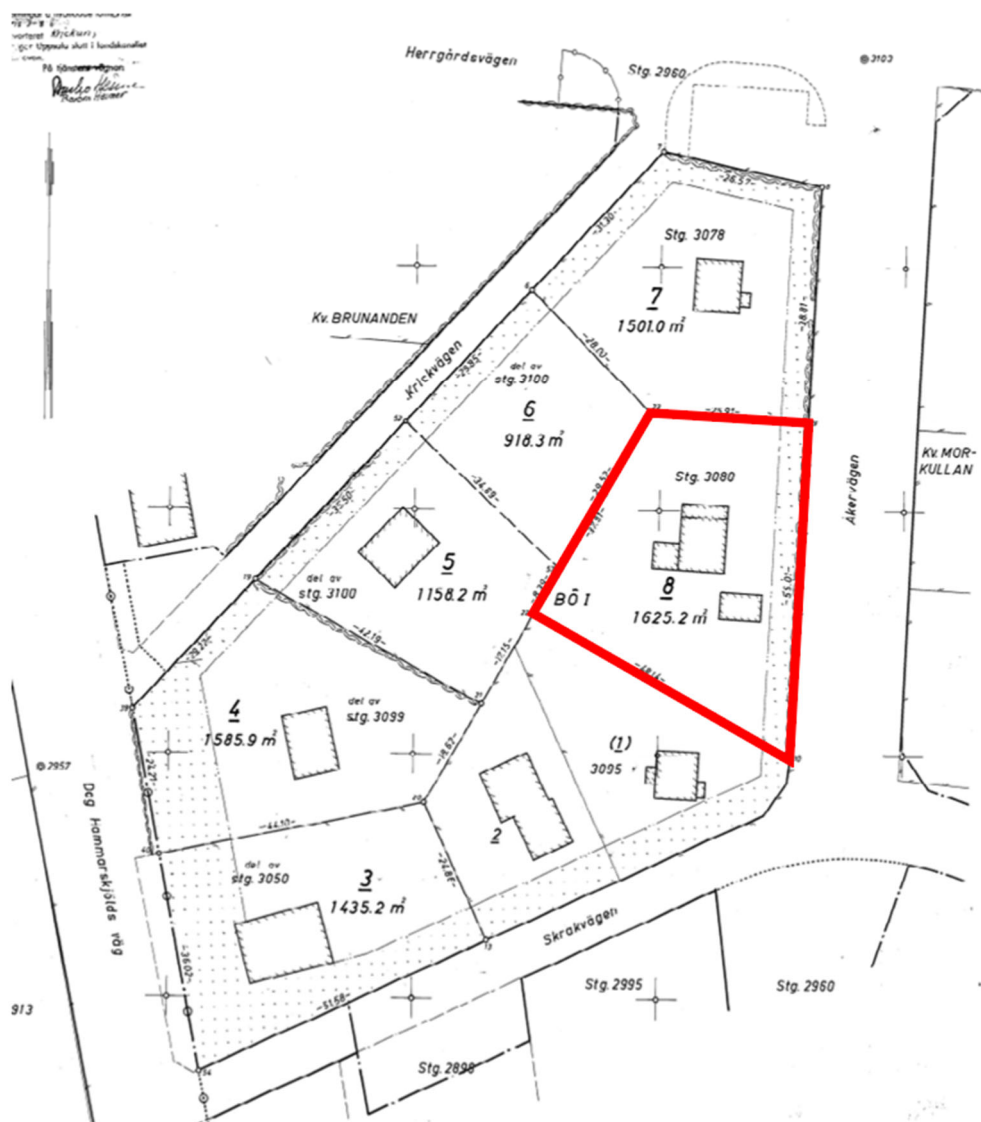
Figur 6. Utklipp ur tomtindelningen som gäller för fastigheten Sunnersta 150:4.