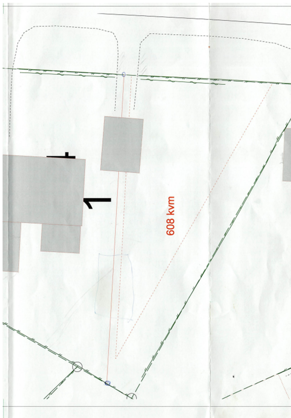
Figur 7. Utklipp som visar möjlig ny fastighetsdelning efter avstyckning.