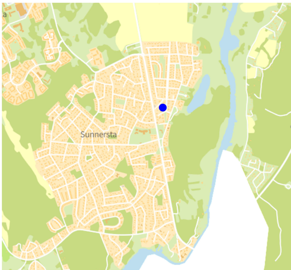
Figur 2. Kartutklipp som visar den aktuella fastigheten markerad med en blå prick.