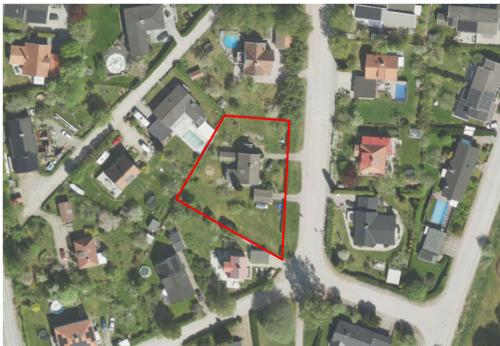
Figur 4. Ortofoto som visar fastigheten Sunnersta 150:4 markerad med en röd linje.