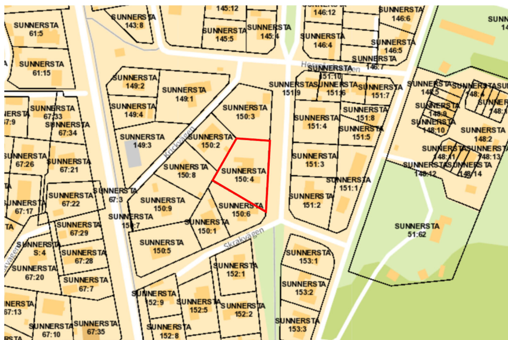
Figur 3. Kartutklipp över fastighetens läge inom kvarteret och dess närmaste omgivning. Fastigheten är markerad med en röd linje.