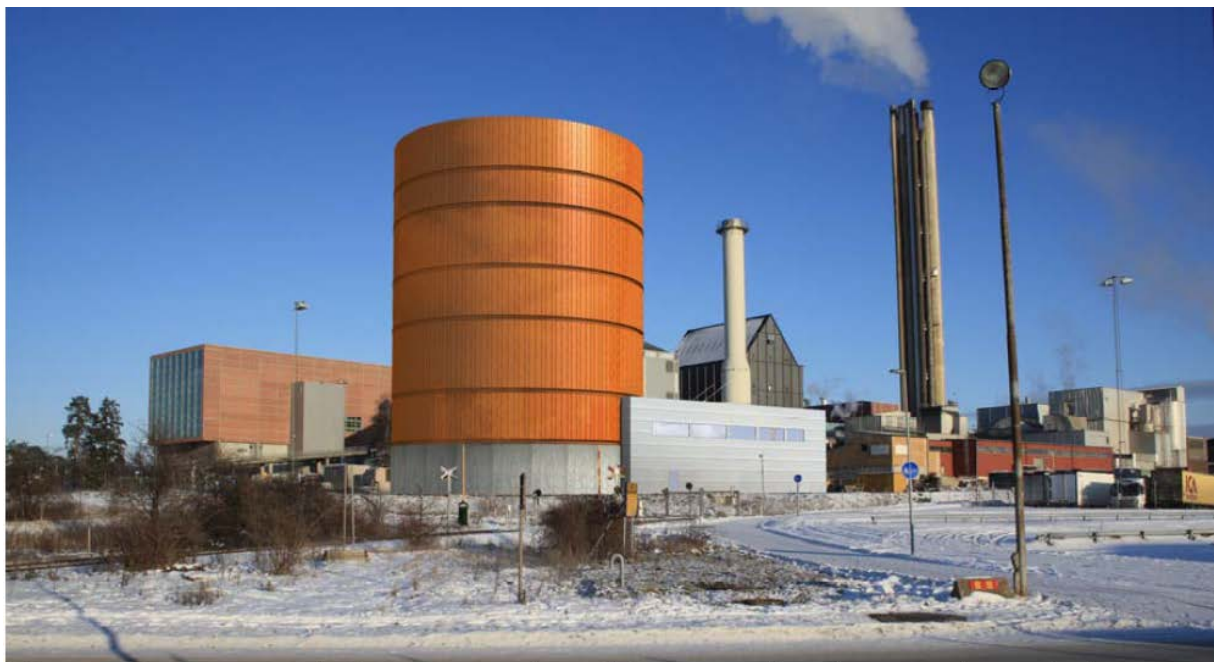
Illustrationen ovan visar kylagertornet täckt med slät cortenplåt och ett tungt betongfundament. Komplementbyggnaden till höger är nedtonad och täckt med grå metallplåtar.