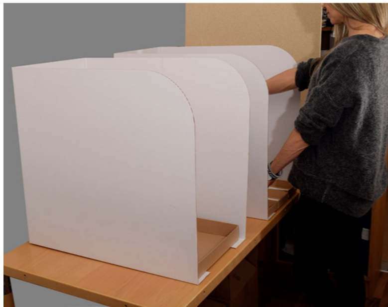
Avskärmning till valsedelställ