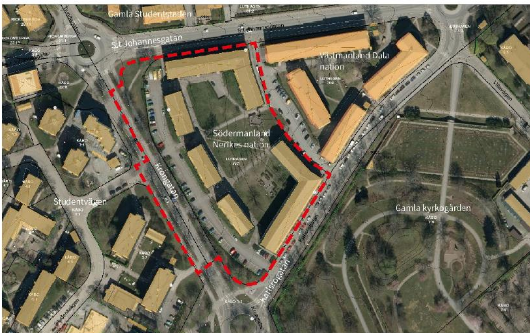
Bild 3 Flygfoto som visar planområdet och dess omgivning. Röd streckad linje markerar planområdet.