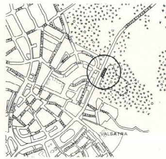
Översikt skala 1:15000