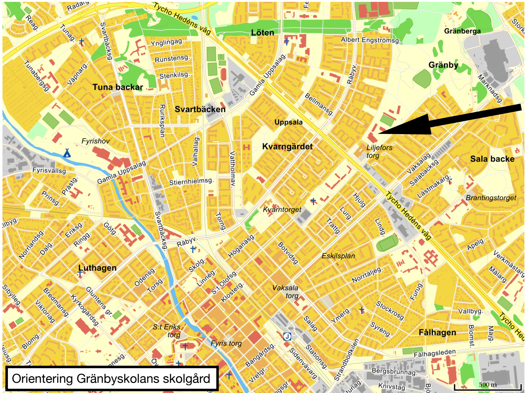
Orientering Gränbyskolans skolgård