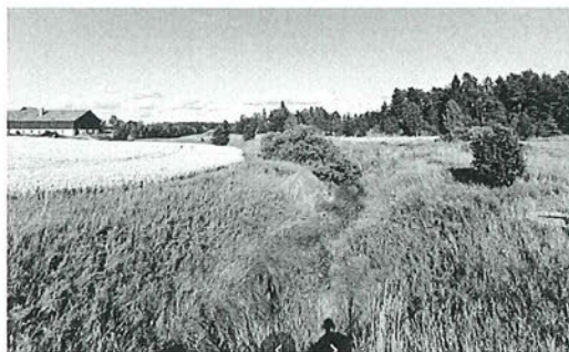
Fibyån norrut från Fibyvägen