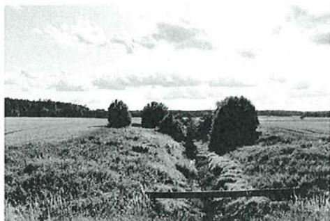
Fibyån söderut från Fibyvägen

Vi i Uppsalaalliansen (C, M, och KD) anser att strandskyddsdispens kan beviljas. En avvägning ska göras mellan det enskilda intresset att genomföra åtgärden och strandskyddets syften. En inskränkning i den enskildas rätt att använda mark eller vatten får inte gå längre än vad som krävs för att syftet med strandskyddet ska tillgodoses. Ansökan avser en tilltänkt byggnad som, relativt sett, ska placeras rätt långt från Fibyån. Andra byggnader i närheten är placerade intill Fibyån. Om dispens och bygglov meddelas kommer befintlig bebyggelse i denna del av landsbygden på ett naturligt sätt att förlängas och kompletteras. Fibyån går här relativt djupt i naturen och synes vara överbevuxen med ett begränsat flöde. Mellan den tilltänkta byggnaden och Fibyån går idag en väg som är upphöjd över omgivande natur och kan därför sägas ha en avskiljande funktion som i sig i praktiken bedöms avhålla allmänheten från naturlig passage. Vi bedömer att den tilltänkta byggnationen inte på ett nämnvärt sätt skulle påverka allmänhetens tillträde till Fibyån och dess närhet om sådant intresse skulle finnas eller livsvillkoren för djur- och växter på land eller i vattnet. Med beaktande härav anser vi att det föreligger särskilda skäl att bevilja strandskyddsdispens.