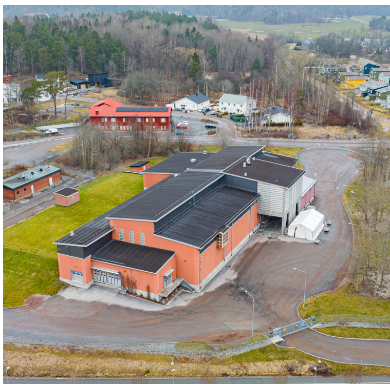
Figur 4 Flygfoto över befintlig byggnad på fastigheten.

Tillbyggnaden är tänkt att placeras i anslutning till vattenverkets sydvästra del, väl synlig från Gottsunda allé. Tillbyggnaden ska anpassas till den befintliga byggnadens gestaltning och karaktär i framför allt material och färgsättning. Den kommer även att förses med ett låglutande tak likt befintlig byggnad. Detta styrs genom att en ny bestämmelse f_1 införs samt att högsta tillåtna totalhöjd för tillbyggnaden regleras till 16,5 meter.