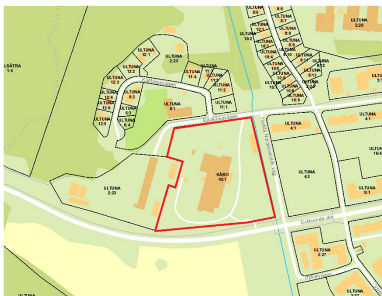
Figur 3 Områdeskarta med fastighetsgränser. Planområdet markerat med röd linje.