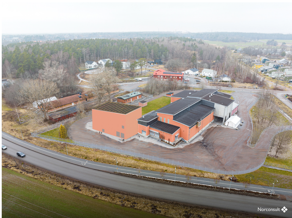
Figur 5 Fotomontage som visar befintlig byggnad och möjlig utformning av tillbyggnaden. Illustration: Norconsult.