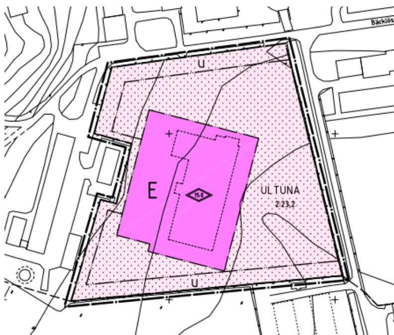
Figur 1 Gällande detaljplan för Kåbo 43:1.

sträcker sig längs fastighetens gränser mot norr, väster och söder. Planen reglerar också att delar av marken inte får bebyggas.