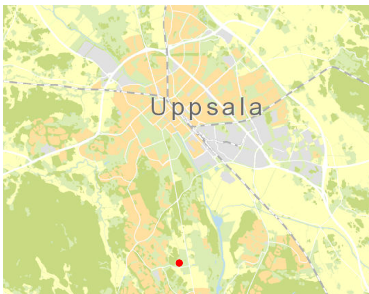
Figur 2 Översiktskarta med planområdets läge markerat med röd prick.

Planområdet avgränsas i söder av Gottsunda allé och i öster av Hedda Nordenskiölds väg.