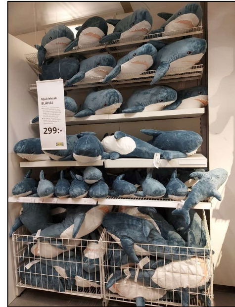
Ett populärt utflyktsmål.