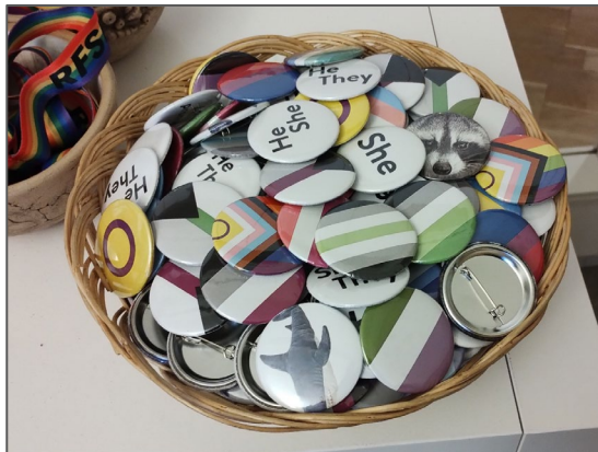
Pronomen- och flaggpins.