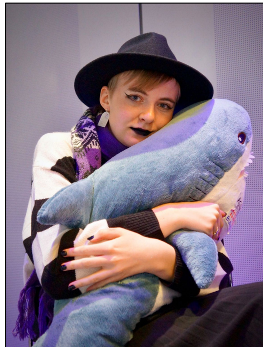
Agda (t.h) tröstar en besökare.