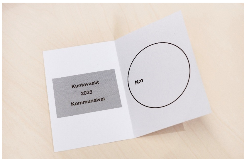
Figur 5.2 Exempel finsk neutral valsekel, kommunalval 2025

I april 2025 genomfördes samtida välfärdsområdes- och kommunalval i Finland. I välfärdsområdesvalet var 4 procent av rösterna ogiltiga. I kommunvalet var 1,6 procent av rösterna ogiltiga. Andelen röster som ogiltigförklarades var högre än när sådana val förrättats enskilt men något lägre än när sådana val tidigare förrättats samtidigt i Finland. 6