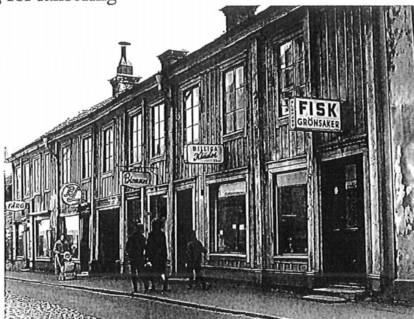
Dragarbrunnsgatan i kvarteret Kransen 1965.