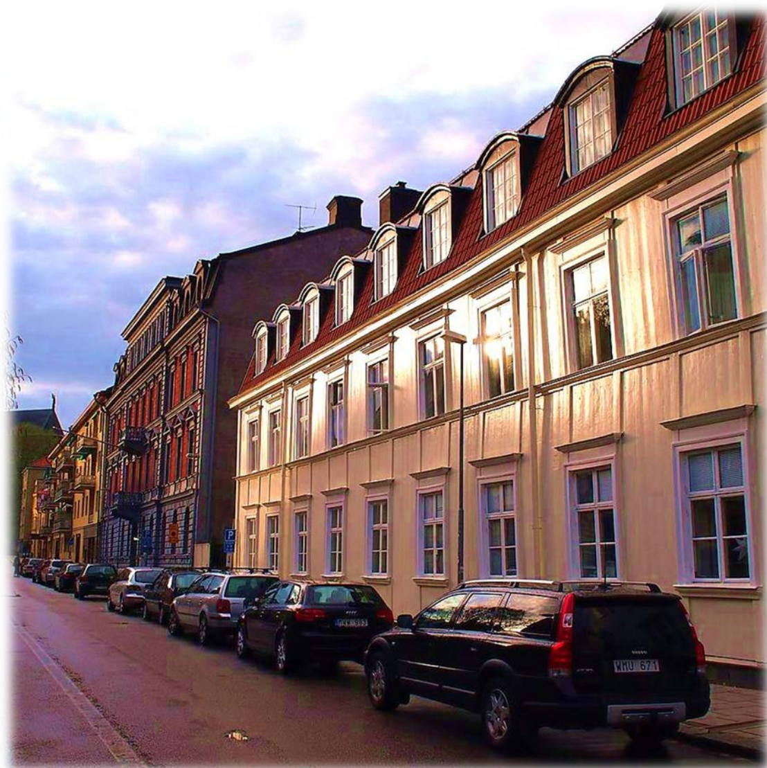
Bättre med infartsparkering än fler gatuparkeringar i centrala staden