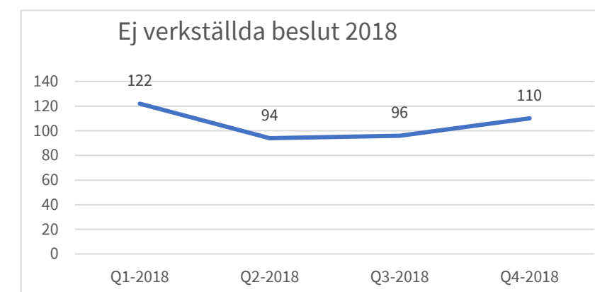
Tabell 2. Totalt antal verkställda SoL-och LSS-beslut

Kommentar till tabell 1: Siffrorna avser beslut där det gått mer än tre månader sedan beslutsdatum eller avbrottsdatum, och som därmed rapporteras till IVO.