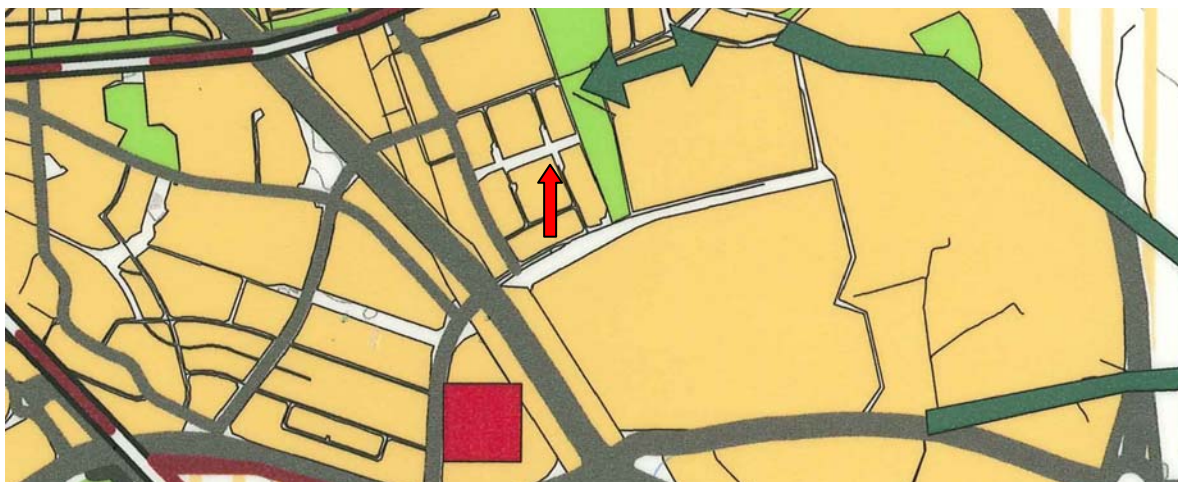
Utdrag ur Översiktsplan 2002 Planområdet markerat med pil.

I översiktsplanen betecknas Fyrislund som stadsbygd. Ett senare upprättat program beskriver en fortsatt utveckling av Fyrislund ut mot E4.