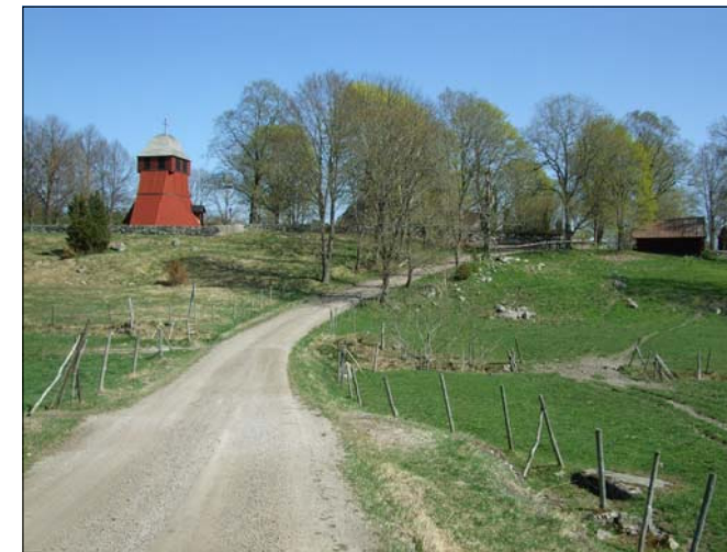
Vy från den gamla vägen mot kyrkbyn med klockstapeln i fonden.

Områdesbestämmelserna har utarbetats av kontoret för samhällsutveckling.