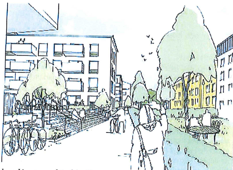
Förslagsskiss, perspektiv från Ringgatan. (KARAVAN arkitektur och landskap)