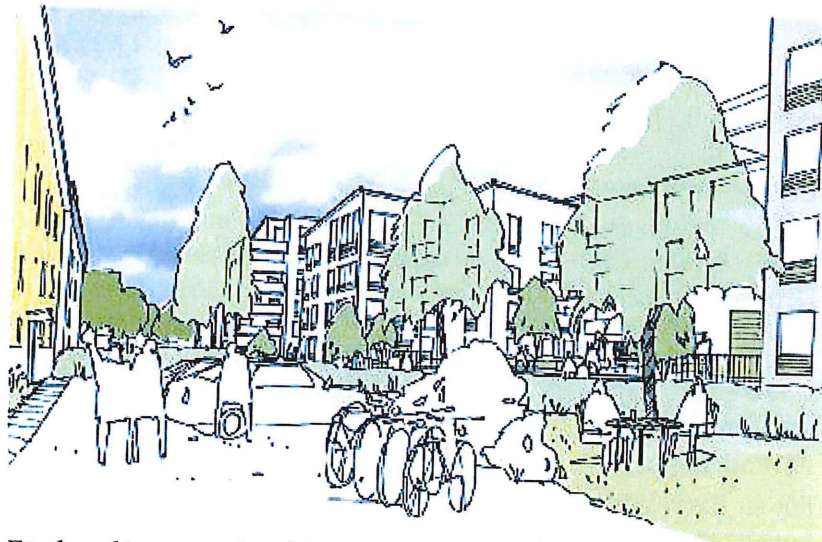
Förslagsskiss, perspektiv från Luthagen 41:2. (KARAVAN arkitektur och landskap)