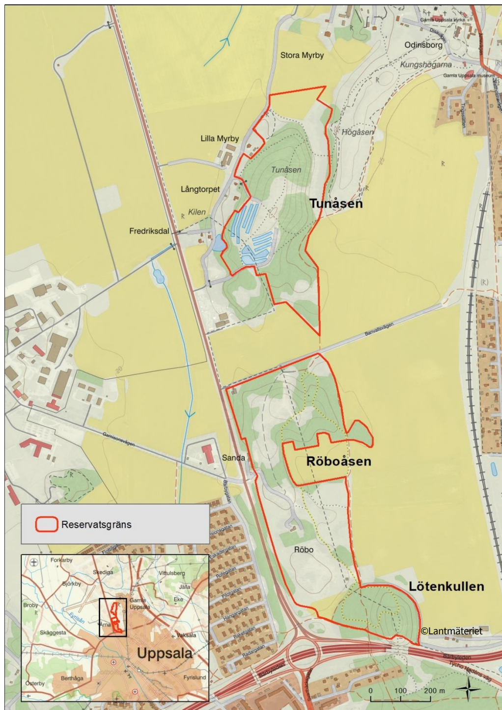
Figur 1 Gräns för naturreservatet.

Tillhör samråd om förslag till beslut för naturreservatet Gamla Uppsala åskullar dnr 2021-003317.